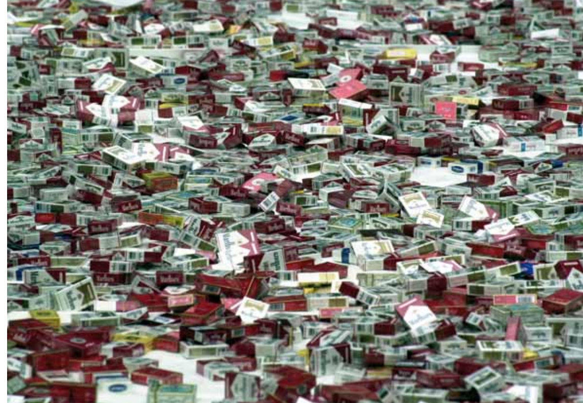
Destruction de cigarettes

Elle contribue donc, en s'opposant aux risques de fraude sur le commerce international, à la sécurité des citoyens, préserve l'environnement, défend les consommateurs et soutient l'économie légale.