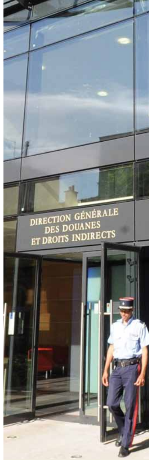
Direction générale des douanes et droits indirects