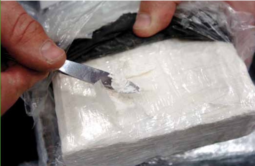
Saisie de cocaïne