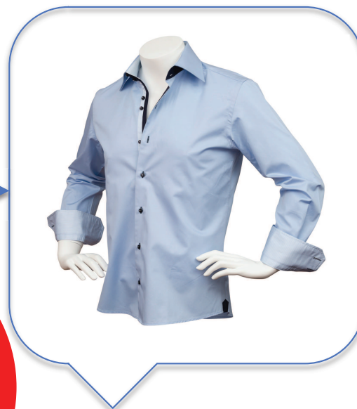
Couture des boutons en France

La chemise ne peut prétendre au « Made in France ».